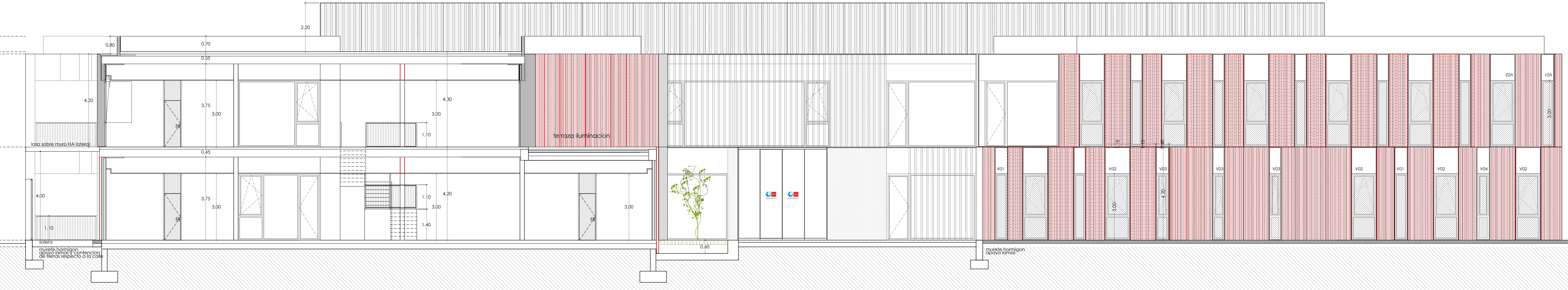
SECCION LONGITUDINAL 01_E:1/100